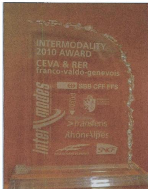
Le Trophée 2010.

C' est à Bruxelles que s'est tenu la semaine dernière le Congrès Intermodos, congrès international dédié à l'intermodalité du transport de voyageurs. Ce rendez-vous annuel, à vocation européenne, qui rassemble élus et professionnels du transport de personnes, acteurs des télécommunications, de la finance et de l'énergie des 27 Etats membres de l'Union européenne, met en exergue les avancées intermodales qui seront proposés dans les